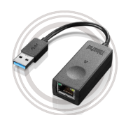
ThinkPad USB3.0 to Ethernet Adapter