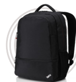
ThinkPad Essential 15.6"