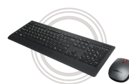
Combo profissional teclado e mouse sem fio Lenovo